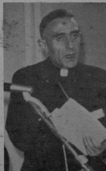
Mons. Eduardo Pironio