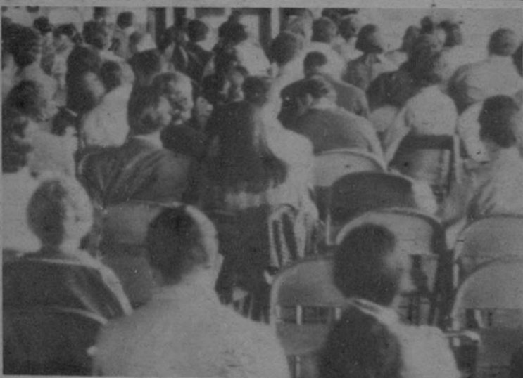
Como en muchos latifundios y tierras incultas, en Río Frío los campesinos que viven en precario y han cultivado la tierra, están siendo desalojados por los terratenientes con el apoyo de la autoridad.