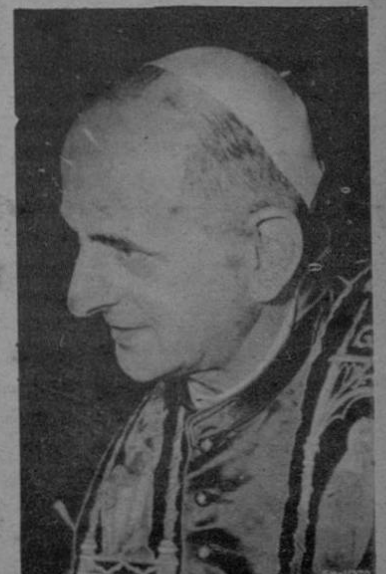
S. S. Pablo VI